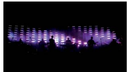
Massive Attack